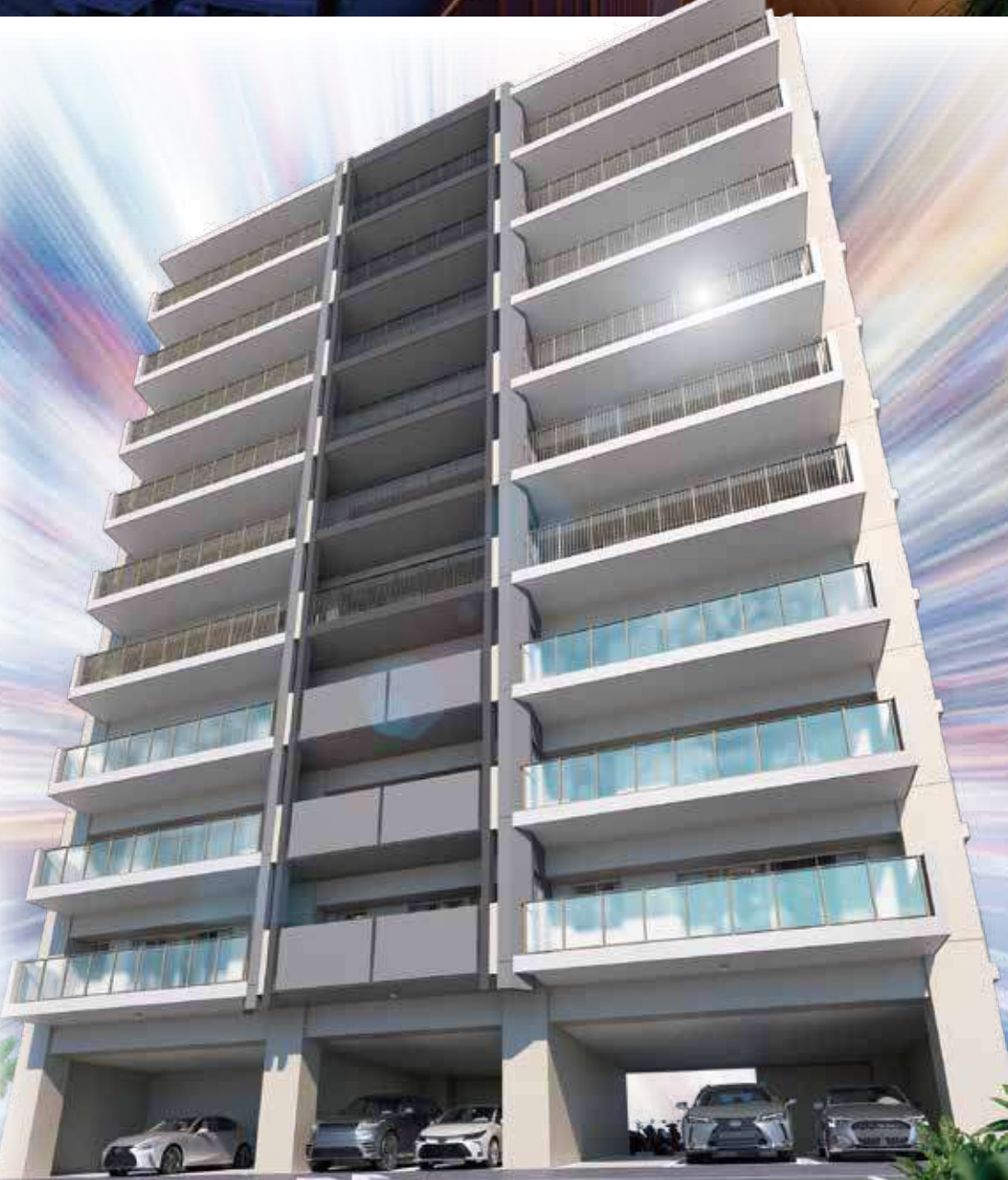
[外観完成予想CGパース]

※掲載の外観完成予想CGパースは、設計図面を基に描いたもので実際とは異なる場合がございます。