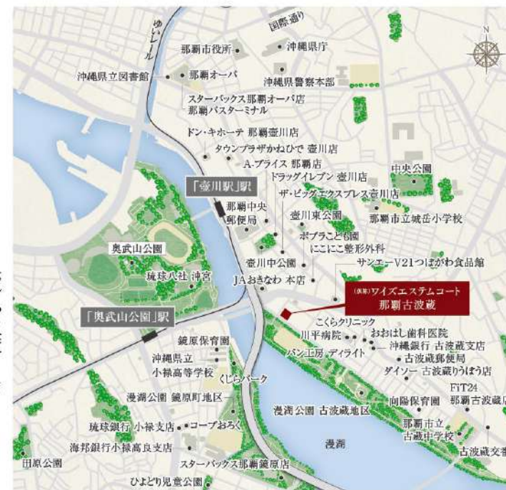
※2026年4月時点の情報です。