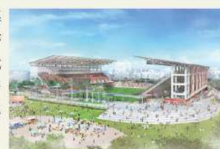
※令和13年度供用開始予定(イメージ図)

奥武山公園では現在、観客席1万人規模 の「J1規格スタジアム」を整備する計画が 推進されています*。完成後はJリーグの試 合のほか、民間のスポーツ大会等も開催予 定。活気あふれるスポーツの楽園として、那 覇のオアシスはますます進化していきます。