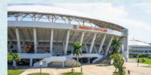
沖縄セルラースタジアム那覇(奥武山公園内)

プロ野球のキャンプ地としても知られるスタジアム。 NAHAマラソンやヨガ教室など、多彩なイベントが 開催されています。