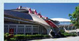
沖縄県立武道館(奥武山公園内)

剣道や柔道だけでなく、コンサートや展示会なども 開催される、最大3,000人を収容可能な武道館。