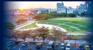
新都心公園 / 約1,1km (徒歩14分)