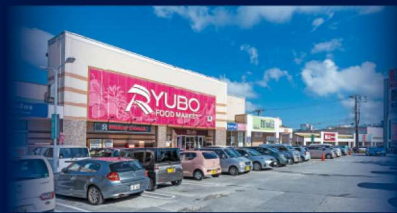
天久りょうぼう楽市 / 約800m (徒歩10分)