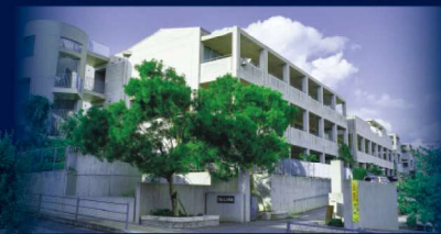
天久小学校 / 約550m (徒歩7分)