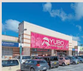
天久うtopia楽市 約800m (徒歩10分)