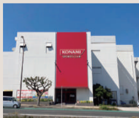
コナミスポーツクラブ 約216m (徒歩3分)