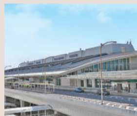
那覇空港 約5.8km (車で17分)