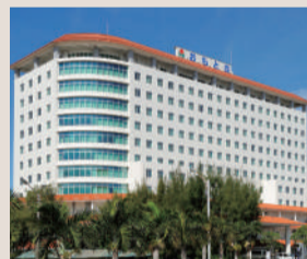
大浜第一病院 約240m (徒歩3分)

※徒歩分数表示は80mを1分で算出(端数切り上げ)したものです。距離は地図上の概測です。