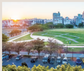
新都心公園 約1.1km (徒歩14分)