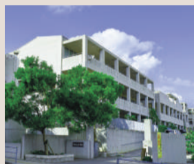
天久小学校 約550m (徒歩7分)